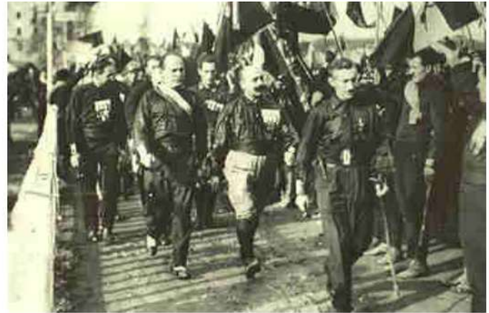
Doc.2 : La marche sur Rome.

Issu d'un milieu modeste, devenu instituteur, il est d'abord attiré par les idées socialistes et pacifistes. Mais la Première Guerre Mondiale le transforme en nationaliste virulent. Il fonde en 1919 les faisceaux de combat puis le parti national fasciste et s'empare du pouvoir en 1922.