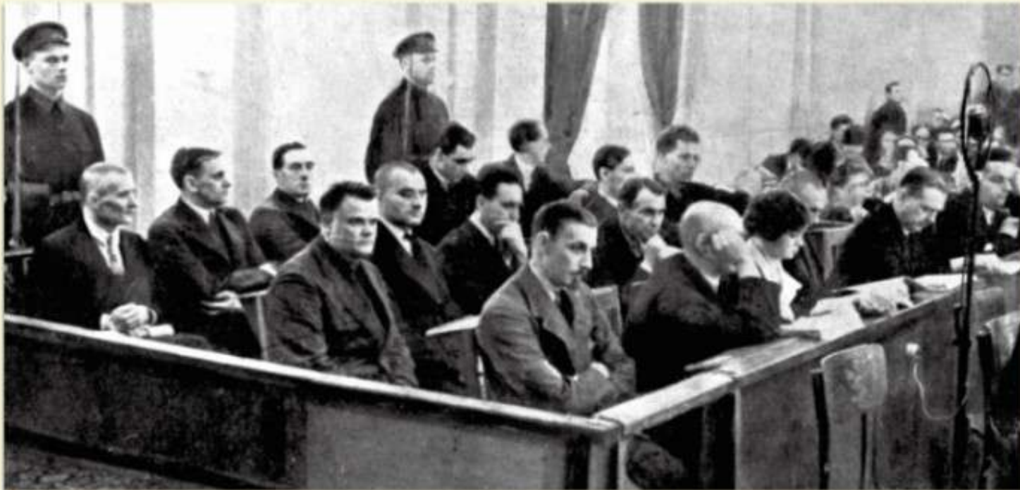
Les procès de Moscou. Lors de grands procès à Moscou, d'anciens compagnons de Lénine sont contraints d'avouer des crimes imaginaires et sont ensuite exécutés.

Expliquez en quoi à consister la Grande Terreur en URSS entre 1937 et 1938 ?