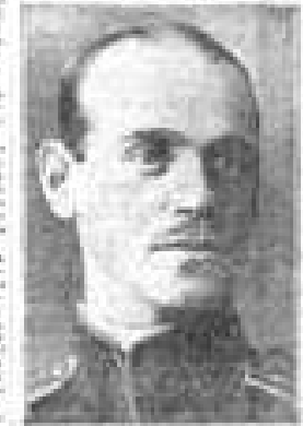
LE PRINCE LVOV, PRÉSIDENT DU CONSEIL DES MINISTRES

Le peuple a obtenu la liberté politique. Le grand-duc Michel Alexandreitch, son frère, a accepté, à la demande du conseil de la République, d'accepter avec le grand-duc Michel, le gouvernement provisoire sous réserve de la tenue et à titre provisoire, la direction des affaires. C'est le prince Lvov qui a été nommé président du Conseil des ministres. Le prince Lvov occupait, jusqu'à présent, la présidence de l'Assemblée des Zemstvos.