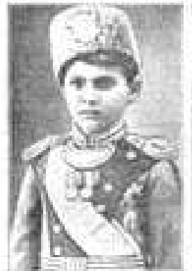
LE NOUVEAU EMPEREUR ALEXIS

Après la Russie libérée, le peuple russe a obtenu la liberté politique. Le grand-duc Michel Alexandreitch, son frère, a accepté, à la demande du conseil de la République, d'accepter avec le grand-duc Michel, le gouvernement provisoire sous réserve de la tenue et à titre provisoire, la direction des affaires. C'est le prince Lvov qui a été nommé président du Conseil des ministres. Le prince Lvov occupait, jusqu'à présent, la présidence de l'Assemblée des Zemstvos.